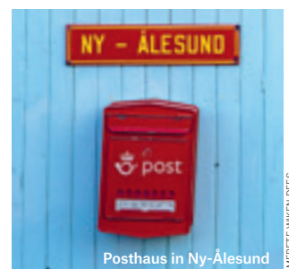
Posthaus in Ny-Ålesund