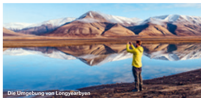
Die Umgebung von Longyearbyen